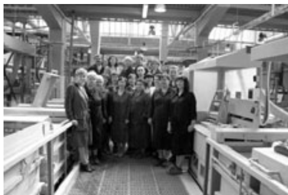
Коллектив участка гальванопокрытий цеха № 4. На новом оборудовании всегда приятно трудиться!

Среди самых значимых событий социального характера следует отметить открытие отстроенной заново заводской базы отдыха «Чайка». Теперь заводчане могут подлечить здоровье не только в своем профилактории «Озон», но и отдохнуть в любое время года на собственной турбазе. Завод профинансировал современные проекты «Чайки»: выстроены новые домики и спортивно-развлекательные объекты (бассейн, поле для мини-футбола с искусственным покрытием и другие). Те из заводчан, кто уже отдохнул в обновленной «Чайке», остались очень довольны.