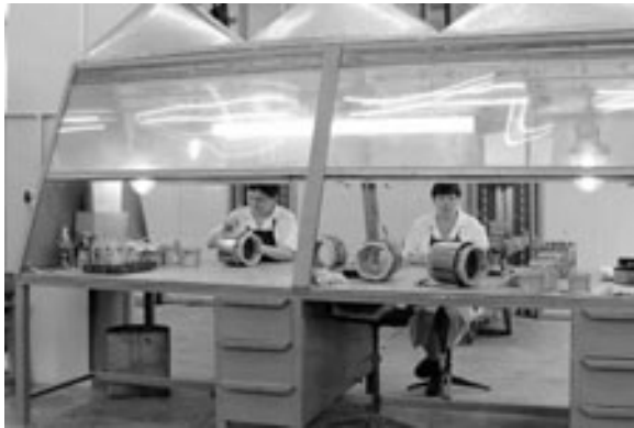
Малярный участок обмоточного цеха после ремонта

- До конца года - еще пара рабочих дней, но уже сегодня мож-