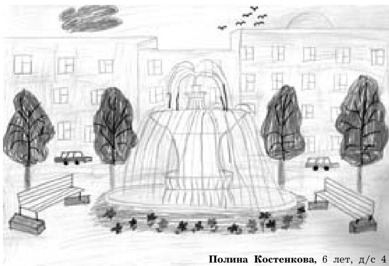
Полина Костенкова, 6 лет, д/с 4

А наши самые юные читатели свой Город Мечты видят с фонтанами и зелеными аллеями