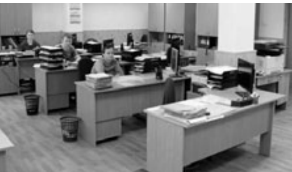
Технологическое бюро цеха 3 после капитального ремонта. Простор для мыслей цеховым технологам обеспечен!

временное высокотехнологичное оборудование.