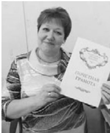
ментов в установленные сроки. Она передает богатый опыт и знания молодым архивистам.

Во многих организациях, документы которых востребованы для обеспечения социальной защиты населения города, Г. Ш. Гафарова добилась положительного решения вопросов выделения отдельных помещений под архивы, упорядочения доку-