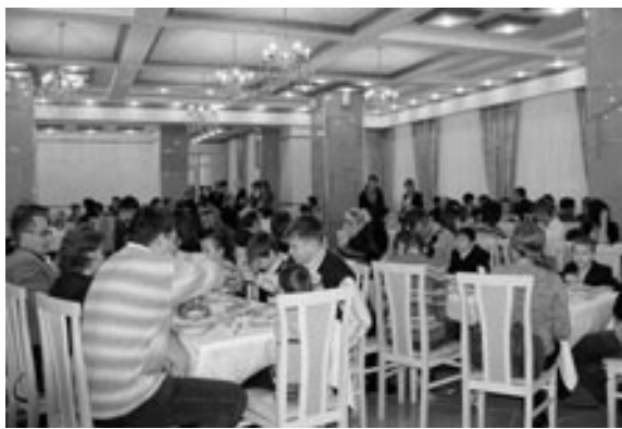
Новый банкетный зал ООО «ЭГЗ-Здоровье» - комбината питания ЭГЗ

Преобразился и заводской комбинат питания: здесь капитально отремонтированы банкетный и обеденный залы, лестничный марш, помещения заготовочных цехов - мясо-овощного и кондитерского. Отремонтированы и открыты накануне Нового года бар и кулинария. При этом закуплено и установлено новое кухонное оборудование, которое позволяет применять в приготовлении пищи самые современные технологии. Например, пароконвектомат, расстоечный шкаф для теста, кремозбивочные машины и другое оборудование. На днях состоялось торжественное открытие комбината питания после реконструкции - с традиционным разрезанием ленточки. Этому событию был посвящен прием у генерального директо-