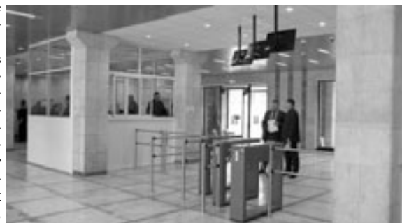
Новая проходная ЭГЗ