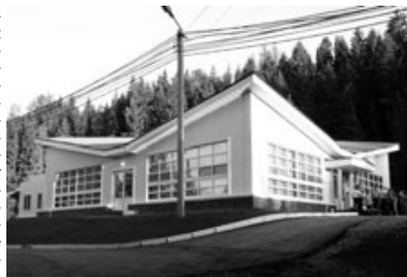
Заводская база отдыха «Чайка» - место паломничества заводчан в течение всего года